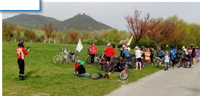
Anreise zur Radparade 2018, Fotohalt auf der Donauiinsel

Um 10 Uhr treffen wir in Floridsdorf im Wirtshaus am Wasserpark ein, wo Zeit zum Einkehren und zur Stärkung bleibt. Die Weiterfahrt erfolgt um 11 Uhr, unterwegs kommen am Gaußplatz RadlerInnen aus der Brigittenau hinzu. Die Radparade selbst startet um 12 Uhr vor dem Burgtheater.